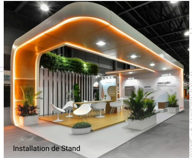
Installation de Stand